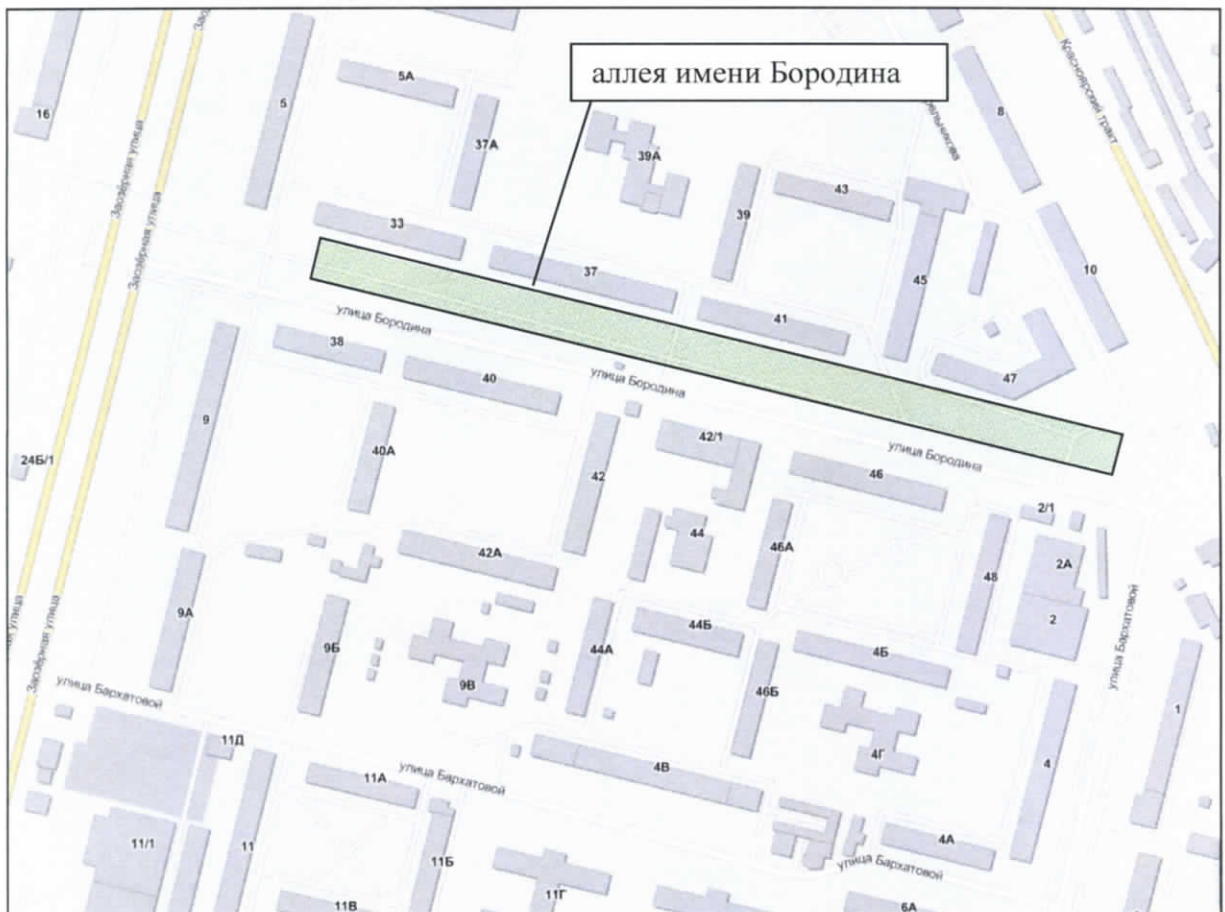
Схема размещения аллеи имени Бородина