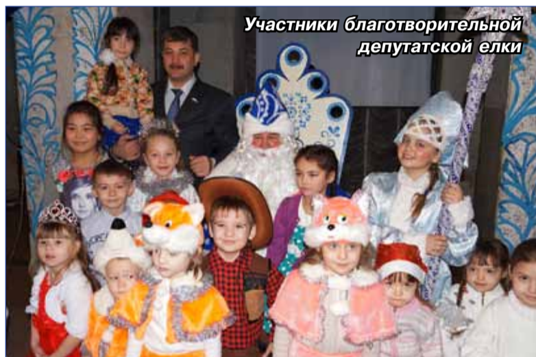
Участники благотворительной депутатской елки

В преддверии Новогодних праздников 250 ребятишек моего избирательного округа приняли участие в проведении благотворительной депутатской елки.