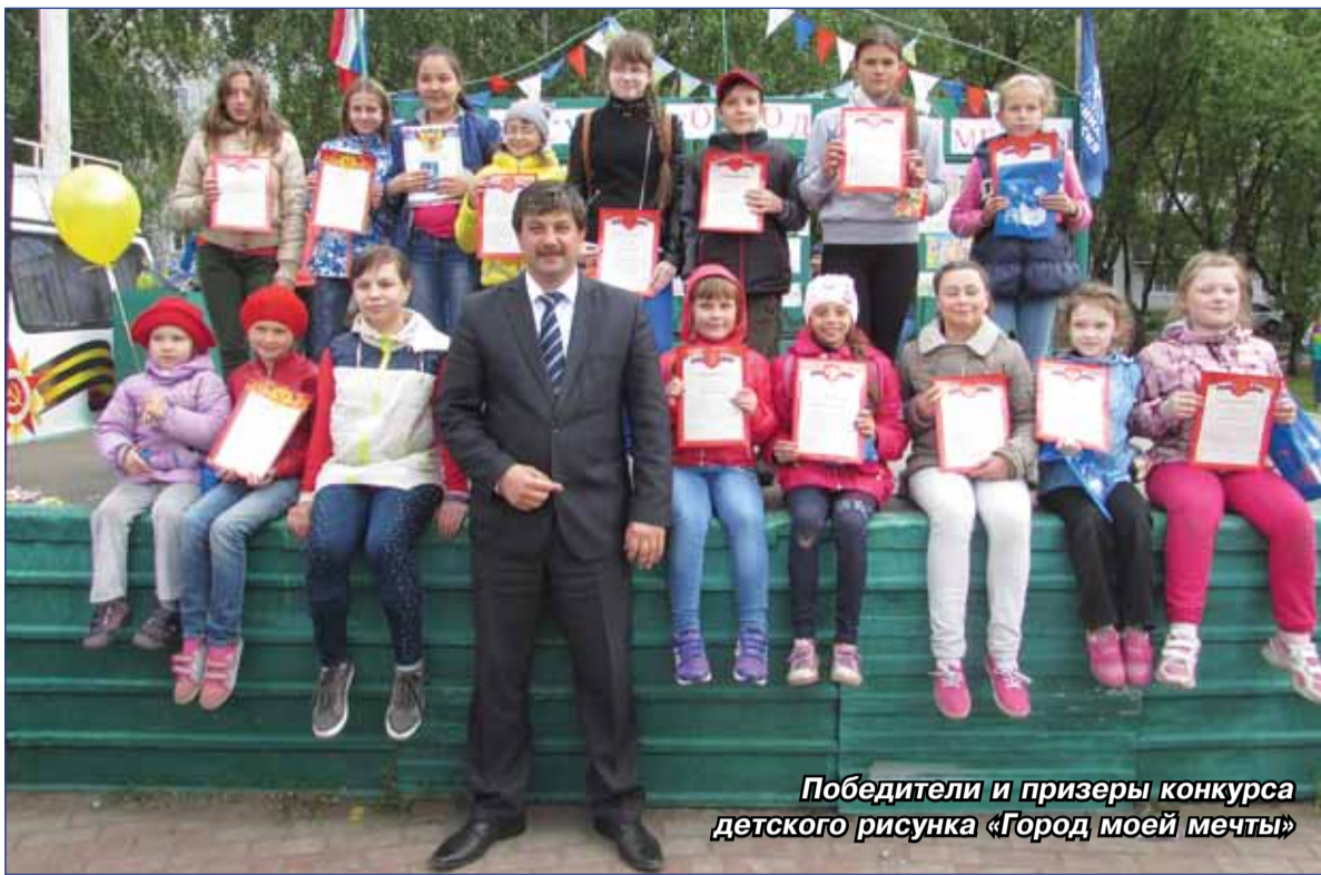
Победители и призеры конкурса детского рисунка «Город моей мечты»

В День защиты детей, 1 июня, на площади Праздников по улице Гашева, 5/2 состоялась торжественная церемония награждения победителей. Памятные призы и подарки получили: