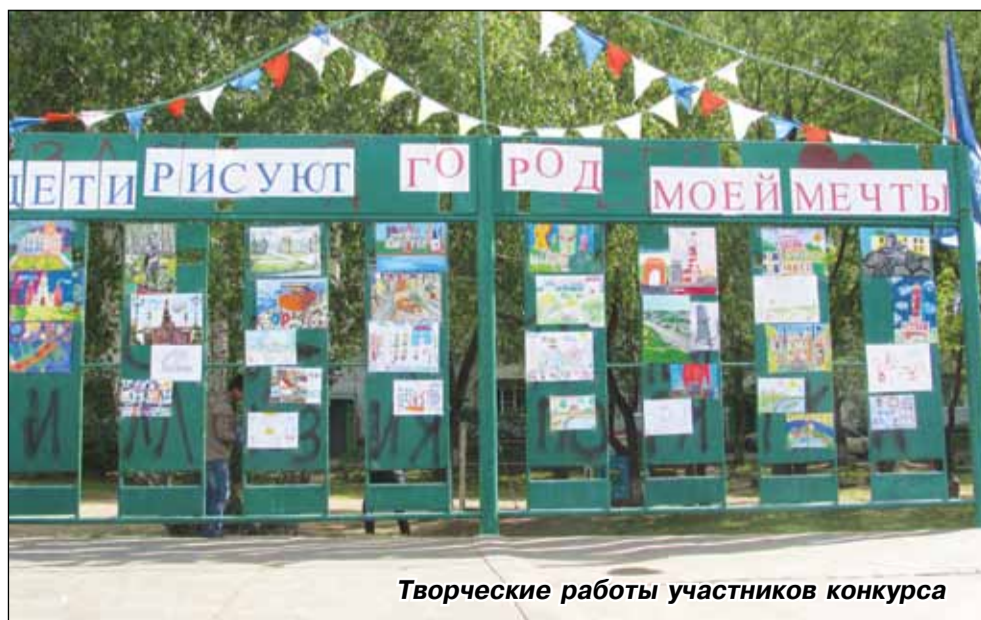
Творческие работы участников конкурса