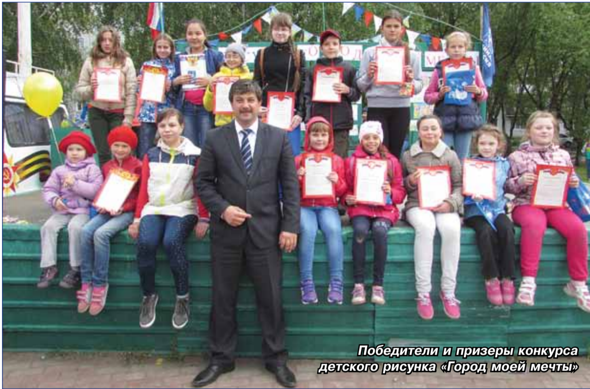
Победители и призеры конкурса детского рисунка «Город моей мечты»

В День защиты детей, 1 июня, на площади Праздников по улице Гашева, 5/2 состоялась торжественная церемония награждения победителей. Памятные призы и подарки получили: