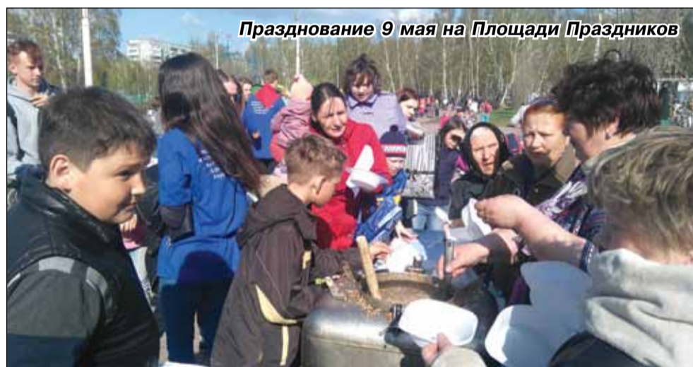
Празднование 9 мая на Площади Праздников