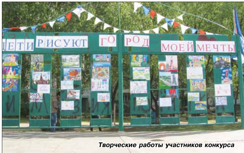
Творческие работы участников конкурса