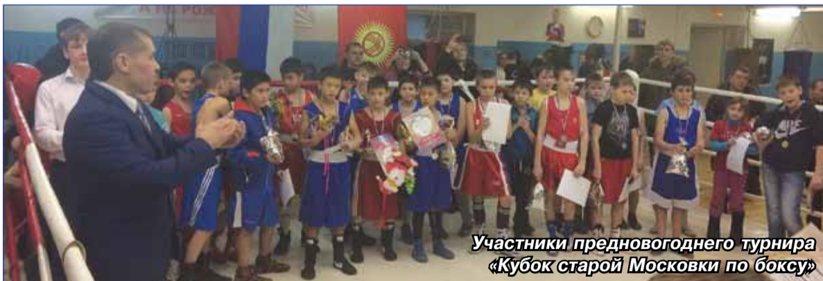
Участники предновогоднего турнира «Кубок старой Московки по боксу»

Кроме того, оказана финансовая помощь СДЮШОР олимпийского резерва № 30 на приобретение спортивного инвентаря, водопроводных труб и сантехники.