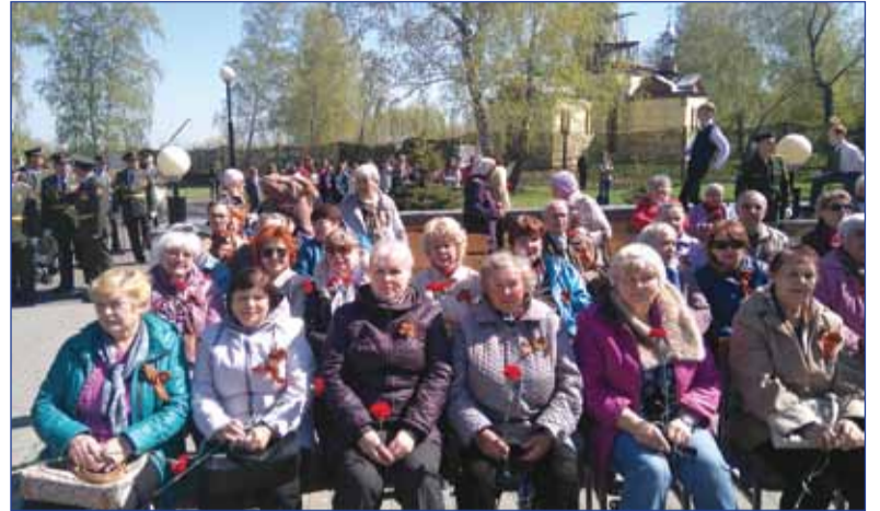
Участники праздничного мероприятия «В лесу прифронтовом».

В ПРЕДВЕРИИ ДНЯ ПОЖИЛОГО ЧЕЛОВЕКА И ДНЯ МАТЕРИ оказал финансовую помощь для про-