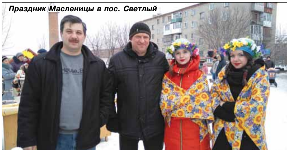
Праздник Масленицы в пос. Светлый