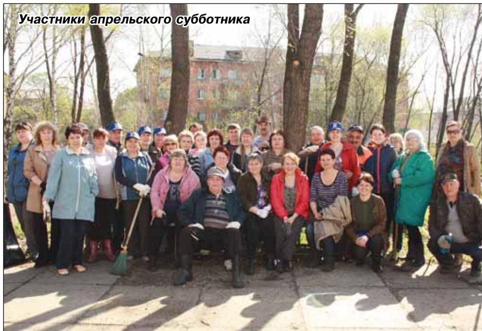
Участники апрельского субботника

Была проведена большая работа по благоустройству придомовых территорий: