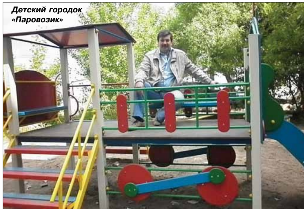
Детский городок «Паровозик»

Установлены четырехместные качели в количестве 15 штук по адресам: Ба-