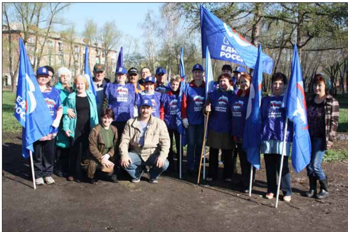
На субботнике в сквере у ДК «Железнодорожник»

В 2016 году продолжилась работа по благоустройству территории избирательного округа: