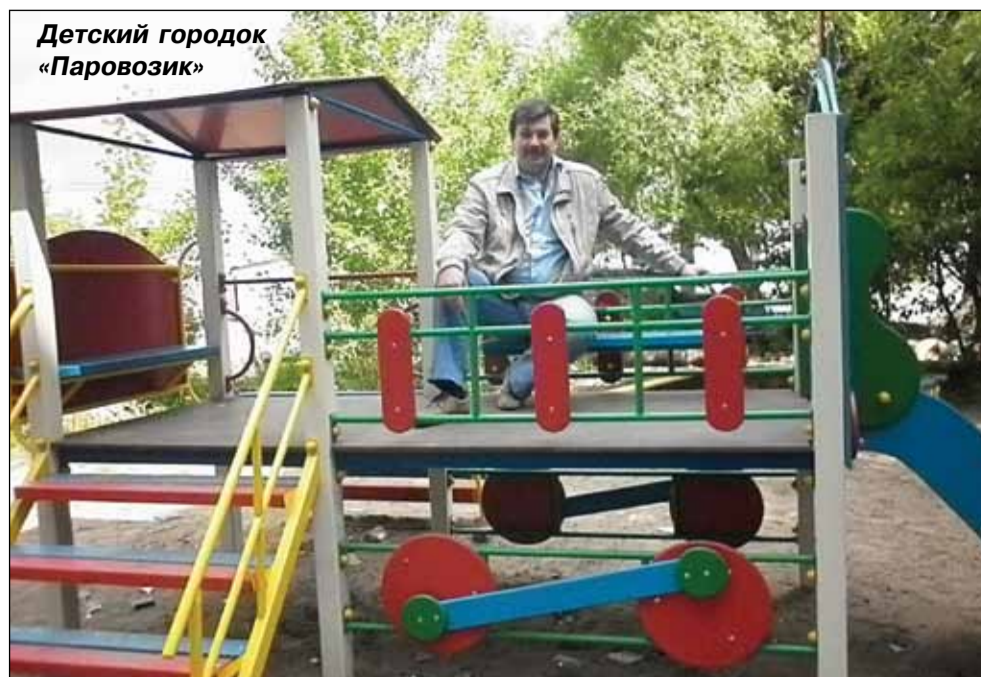
Детский городок «Паровозик»

Установлены четырехместные качели в количестве 15 штук по адресам: Ба-