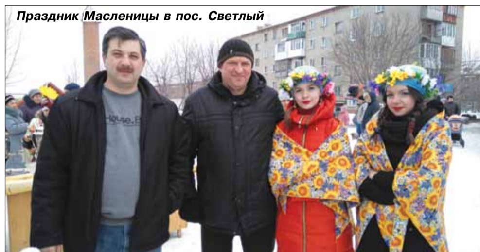
Праздник Масленицы в пос. Светлый