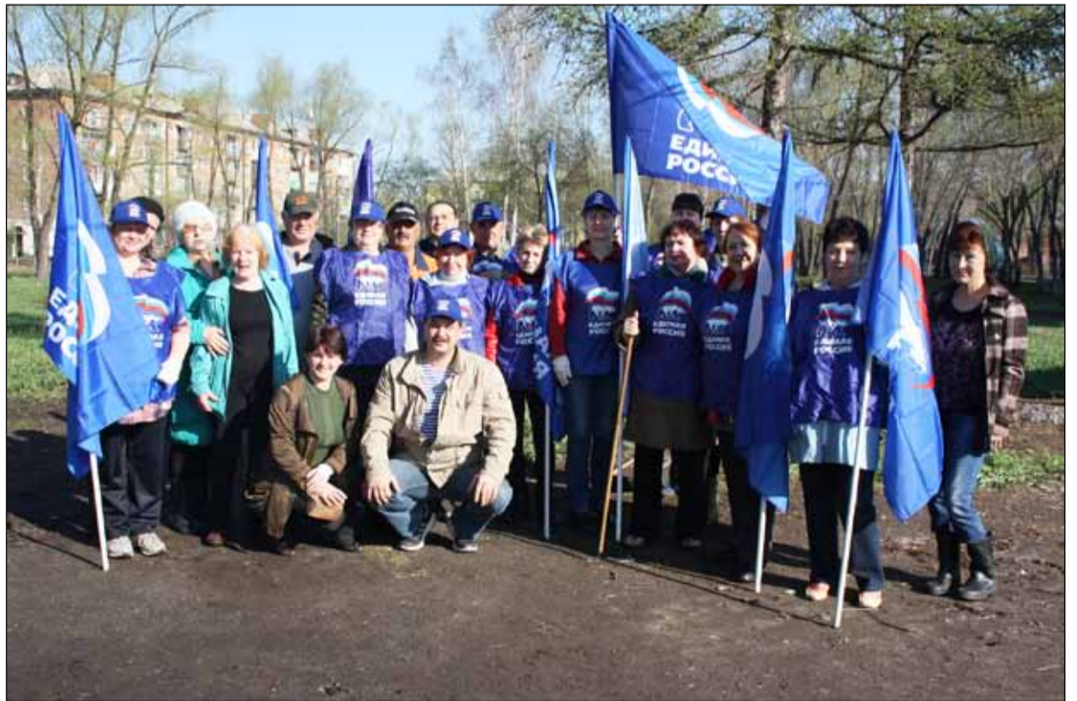
На субботнике в сквере у ДК «Железнодорожник»

В 2016 году продолжилась работа по благоустройству территории избирательного округа: