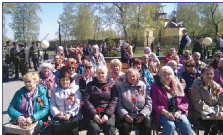
Участники праздничного мероприятия «В лесу прифронтовом».

В ПРЕДВЕРИИ ДНЯ ПОЖИЛОГО ЧЕЛОВЕКА И ДНЯ МАТЕРИ оказал финансовую помощь для про-